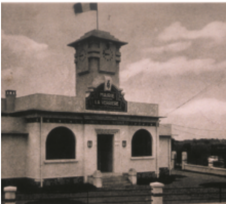
LA VERRIÈRE (S.-O.) - La Mairie